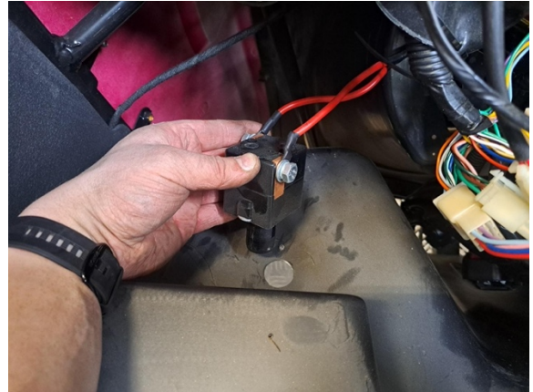
Vedä päävirtakytkin pois paikaltaan.