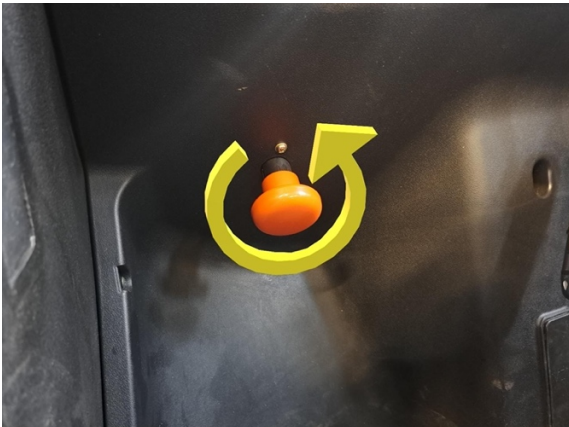
Irrota päävirtakytkimen nuppi vastapäivään kiertämällä.