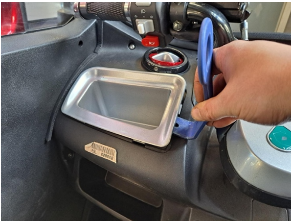
Kampea vasemmanpuoleista säilytyslokeroa. (muovinen sorkkarauta).

Oire: Päävirtakytkin ei katkaise/ kytke virtaa.