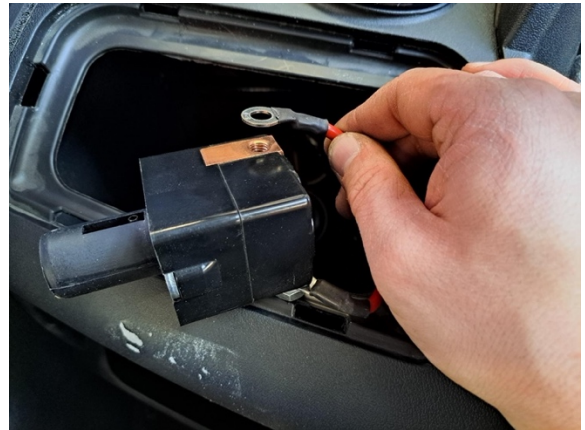
Ota johtimet irti.

Uuden osan asennus käänteisessä järjestyksessä.