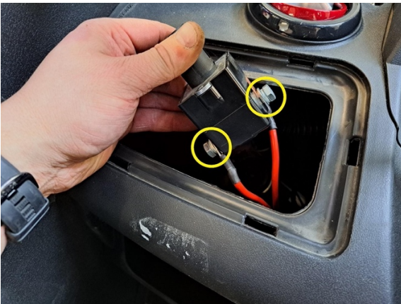
Irrota johtimien kiinnityspultit. (kiintoavain 13 mm).