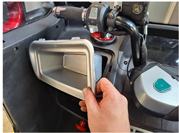
Ota vasemmanpuoleinen säilytyslokero pois.