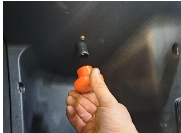
Ota päävirtakytkimen nuppi pois.